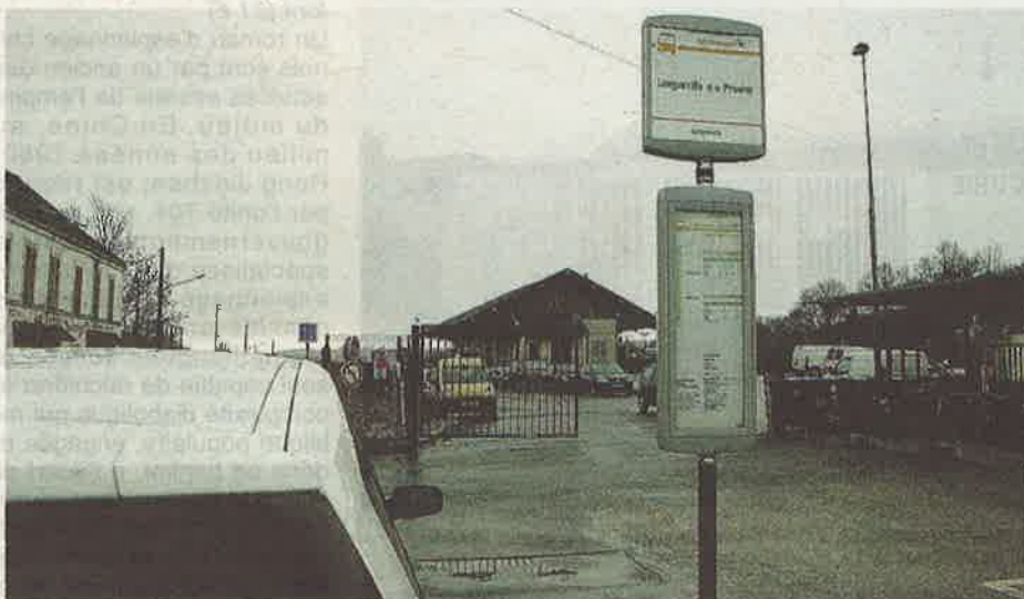
Des bus ont finalement été mis en places pour assurer la liaison Longueville-Provins, pour les usagers des trains au départ de 16 h 16 et 18 h 16 de Paris Est.

Il aura fallu que l'association des usagers ne lâche pas et que les élus viennent en renfort pour obtenir gain de cause. Des bus sont en place depuis mardi 13 octobre, pour assurer la liaison Longueville-Provins pour les usagers des trains de 16 h 16 et 18 h 16 au départ de Paris Est.