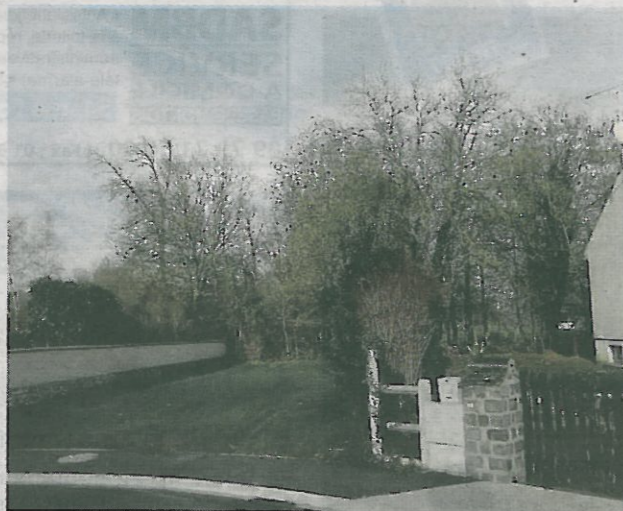
Parcelle du Dragon à Longueville

engagement à respecter l'environnement sur une parcelle communale où passe la rivière du Dragon en provenance de Saint-Loup-de-Naud et se jetant