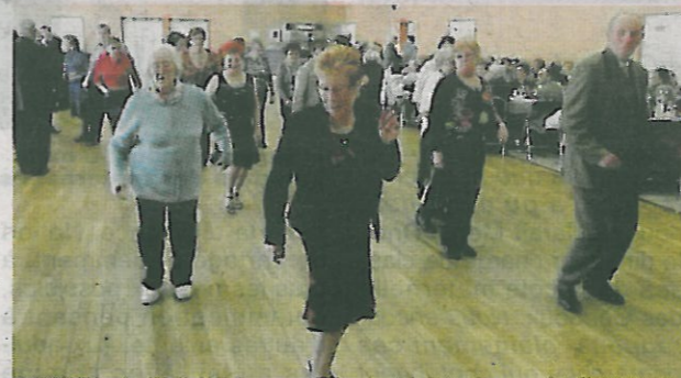
Ca « guinche » au Repas des Anciens