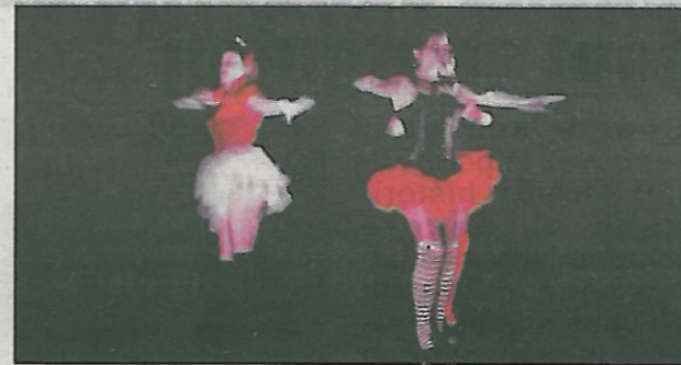
Le charme des « Lady Cops » au Téléthon de Longueville

Comme chaque année, l'association Ecole et Loisirs a activement participé au Téléthon le samedi 7 décembre. Une action qui lui a permis de rassembler 1011 €.